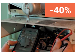
Contrôles réglementaires & sécurité incendie