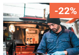
Maintenance et entretien