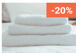
Entretien du linge et EPI