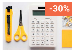
Fournitures de bureau